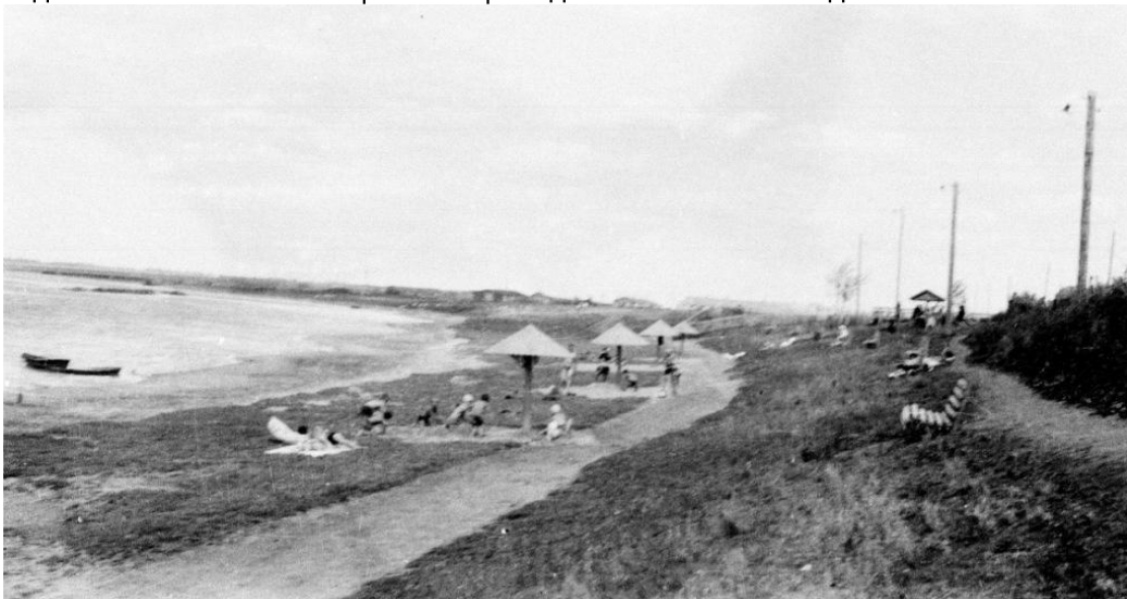
Пляж с. Колыбелька, озеро Песчаное. 1967 год

Отмеченное в статье обустройство пляжа было только началом создания зоны отдыха в селе. Основные работы проведены в 1965-1966 годах.