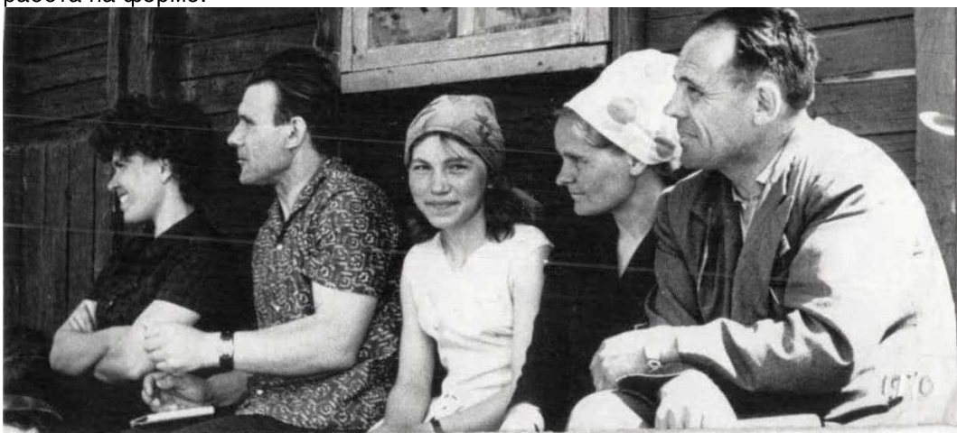
1970 год. Совещание зоотехников района в Кольбельке.