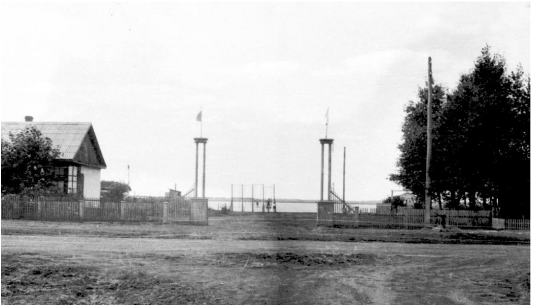
Вход с улицы Центральной на пляж с. Колыбелька, 1967 год