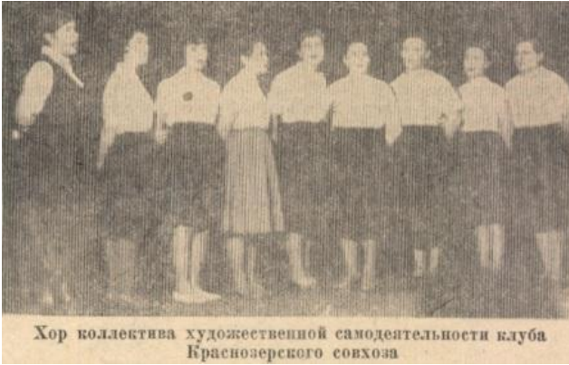
Хор коллектива художественной самодеятельности клуба Краснозерского совхоза