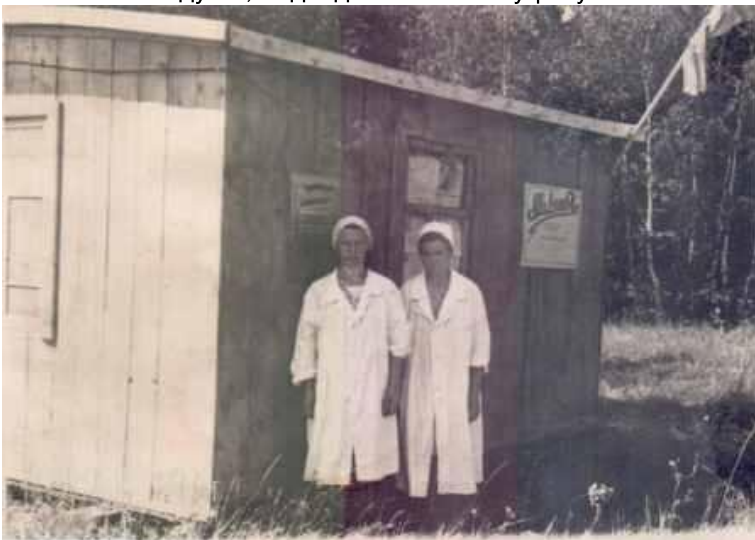
Повара на полевом стане первой бригады.