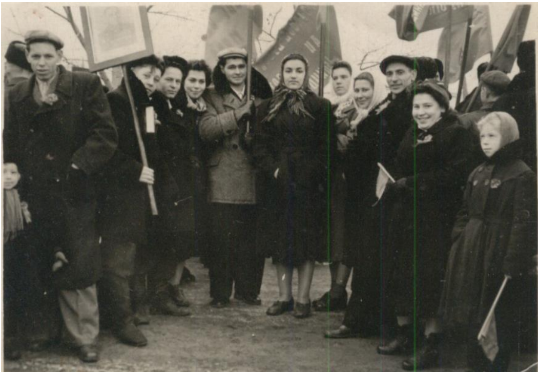
Жители села Колыбелька на демонстрации 7 ноября