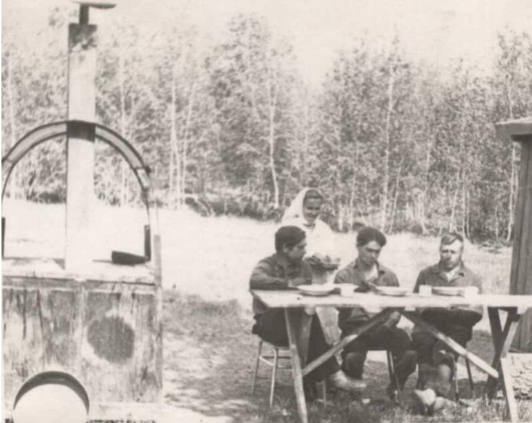
Обед на полевом стане

тали зерноочистительные машины. 5 августа из Краснозёрского совхоза на хлебоприемный пункт поступило первое зерно нового урожая – 1800 пудов ржи.