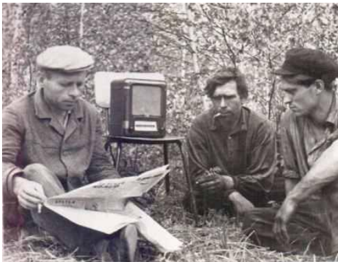
на полевом стане в обеденный перерыв