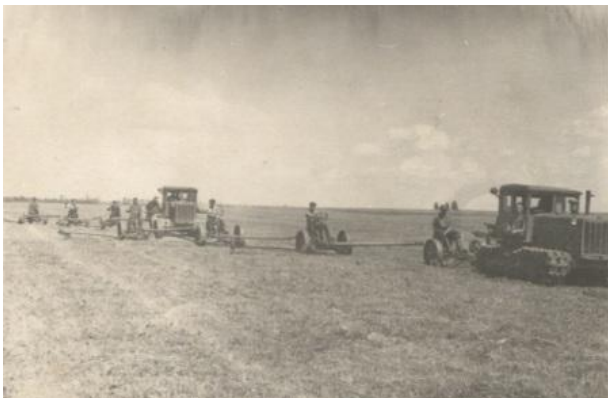
Лето 1956 года. На сенозаготовке.

«Дружно идет работа на лугах Краснозерского совхоза. Две тракторные бригады ведут заготовку кормов для общественного поголовья. Уже скошено 1300 гектаров естественных трав и заскирдовано свыше тысячи центнеров сена.