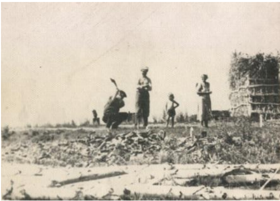
Закладка индивидуального жилого дома, август 1955г.

С наступлением весны закипела работа на строительстве жилья и производственных объектов. В марте все село превратилось в большую строительную площадку. Жильё возводилось из местного материала – камыша, леса, а также ставили привозные сборные (щитовые) финские дома на 4 квартиры, которые стоят и сейчас, переделанные под двухквартирники. Работали весело, с песнями, все дружно. Щитовой дом ставили практически за один день, а через