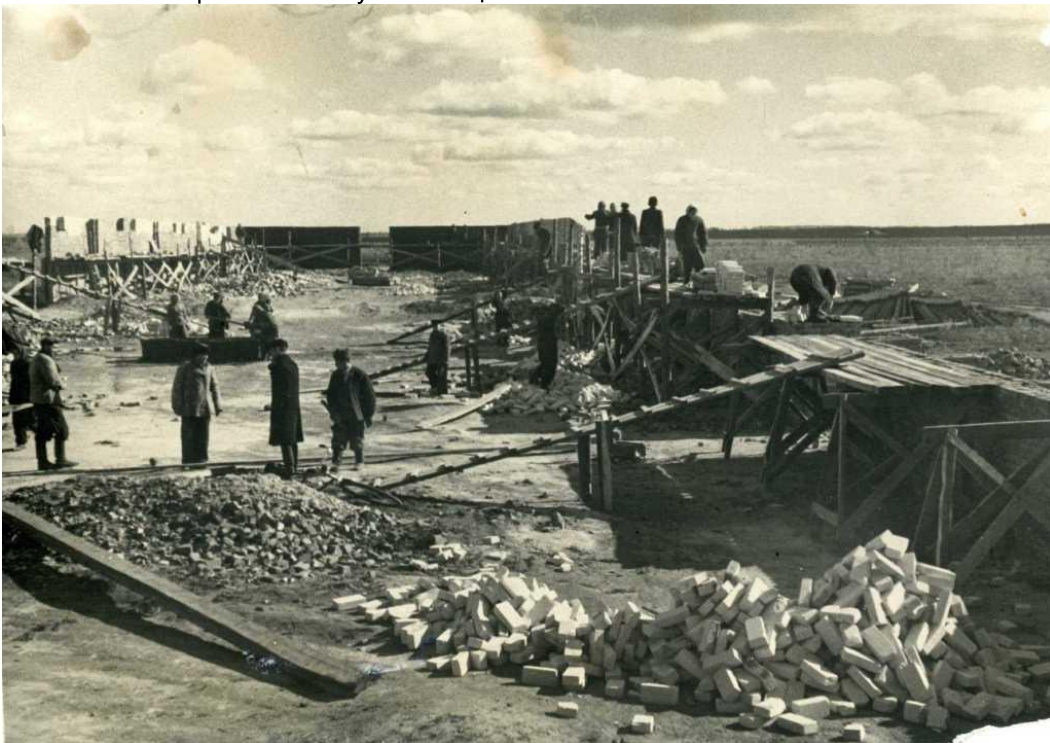
На фотографии строительство зернохранилища, май 1955 года.

неделю заселяли. Значительную часть строительных работ в целинных поселках осуществляло специально созданное в районе в мае Управление СУ-8 треста «Новосибоблстрой». Большую помощь оказывали новоселы.