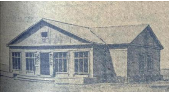
Новый магазин, осень 1955г.